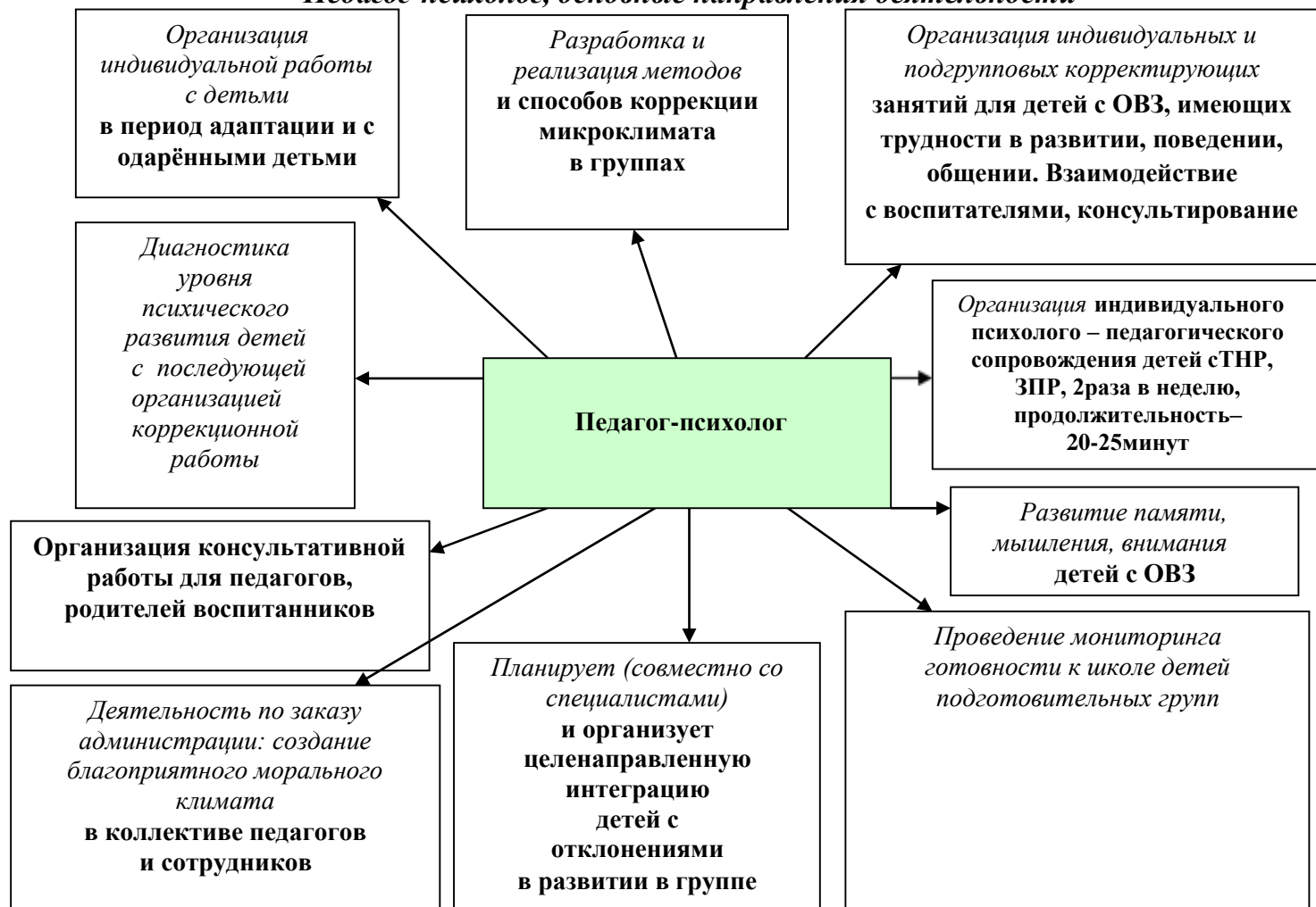
Рис.2 «Педагог-психолог, основные направления деятельности»